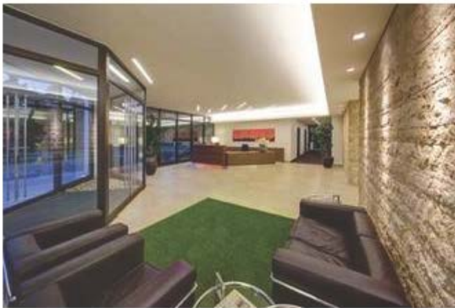
Empfangsbereich eines Unternehmens.

LED-Bleuchtungen sind auf einem rasanten Vormarsch, seit diese langlebigen, kleinformatischen und vielseitigen Lampen so konstruiert werden, dass sie sich für immer mehr Einsatzbereiche bestens eignen. Ob Kfz-Beleuchtung oder Taschenlampe, ob Arbeitsplatz oder Damenboutique, ob Konferenzraum oder Labor, LED-Lampen haben den Alltag von Arbeits-, Verkaufs- und Wohnwelt erreicht. Auch wenn die Anschaffungskosten bisher noch relativ hoch sind, punkten LED-Lampen durch ihre lange Lebensdauer (bis 50.000 Std.) und geringem Stromverbrauch. Die Leuchtenhersteller haben mittlerweile LEDs in viele moderne Leuchten eingebaut, auch wenn die Lösungen noch nicht immer ganz überzeugen. Beeindrucken kann dagegen die mit LED-Leuchtmitteln bestückte Vouten-