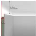
Wandanschluss: oben.